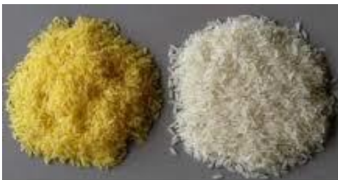
Det gyllene riset får sin gula färg från \beta -karoten vilket är samma färgämne som ger moroten och tomaten dess färg.

I slutet på 80-talet utvecklade Rockefeller Foundation som ett exempel av många, ett program för att skapa en rissort som skulle ”avhjälpa bristen på A-vitamin hos undernärda barn i utvecklingsländerna”. Det kom att kallas ”det gyllene riset”, ”golden rice” eftersom det var gult på grund av tillsatsen av bland annat karoten. 3