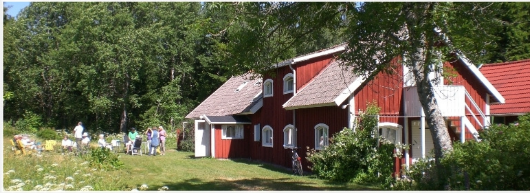
Kosmosgården i Varnhem