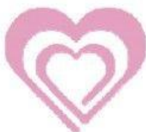
(U) GLogo a.k.a. “Girl Lover,” Childlove