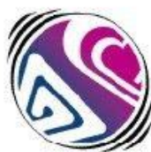
(U) CLOMAL a.k.a. Childlove Online Media Activism