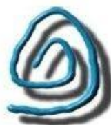
(U) LLogo aka “Little Boy Lover”