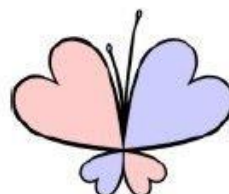
(U) CLogo a.k.a. “Child Lover”