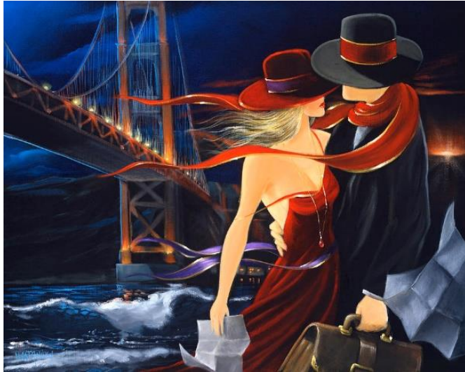
“Bridge over Troubled Water”