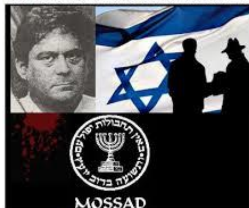
Victor Ostrovsky, Former Senior Israeli Mossad Officer

'Israel helped Saddam use chemical weapons against Iran in the 1980s.' - Victor Ostrovsky.