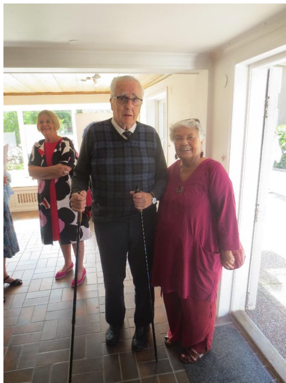
Kusinerna har blivit till åren komna...