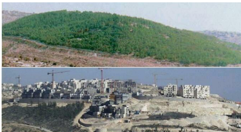
Jabal Abu Ghneim år 1997 och 2001