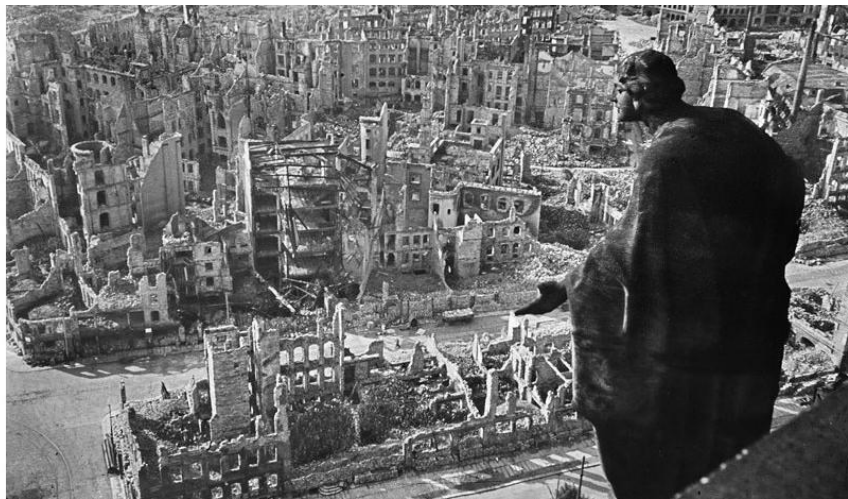
En bild över det totalt förstörda Dresden

Efter att ha läst Thomas Goodrichs ohyggligt avslöjande bok Hellstorm – Nazi Tysklands död 1944–1947 7 så är jag beredd att hålla med. Lasse Wilhelmson nämner en av de absolut vidrigaste historier jag läst om, bland annat i Hellstorm . Det handlar om den ohyggliga massakern i kulturstaden Dresden den 13 och 14 februari 1945, bara drygt ett par månader före krigsslutet. Där genomförde de allierade en verklig förintelse av tyska kvinnor, barn, skadade soldater och flyktingar. Där fanns inga militära mål så bombningarna med bland annat fosforbomber var ren och skär förintelse, både av människorna och av staden. Enorma kulturskatter förstördes.