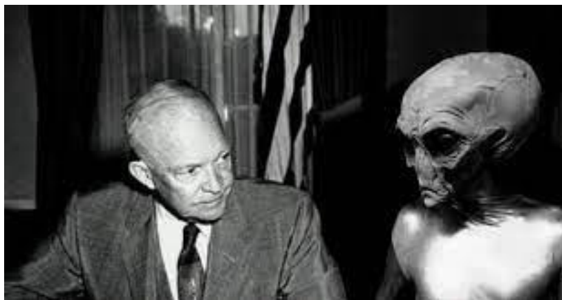
År 1954 lär Eisenhower ha mött en representant för The Grays, de grå, för att göra en överenskommelse.