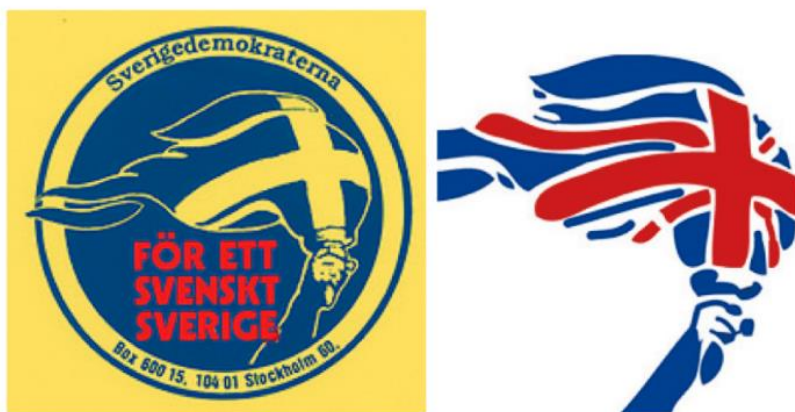
SD:s dåtida fackla och den som används av brittiska fascistpartiet National Front.

Assais ingående berättelse om SDs historia och utveckling väcker många tankar och frågor. Titeln på boken ” Facklan i Riksdagen ” får sin förklaring. Den gamla symbolen för partiet var en fackla (s. 13).