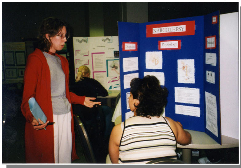
Bedömning av posters som examination