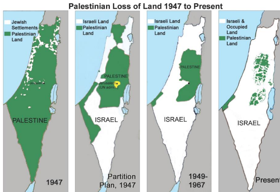
Bilden är hämtad från artikeln A Synopsis of the Israel/Palestine Conflict 12

Men under 1947 och 1948, efter det andra världskriget och efter det att Israel upprättats, fördrevs den palestinska befolkningen. David Duke menar att den sionistiska staten Israel ser som sin uppgift att ”bevara det judiska folkets kulturella och genetiska identitet” (s. 27). Det palestinska folket lever numera i allt mindre utrymmen, ofta i flyktingläger i sitt eget land.