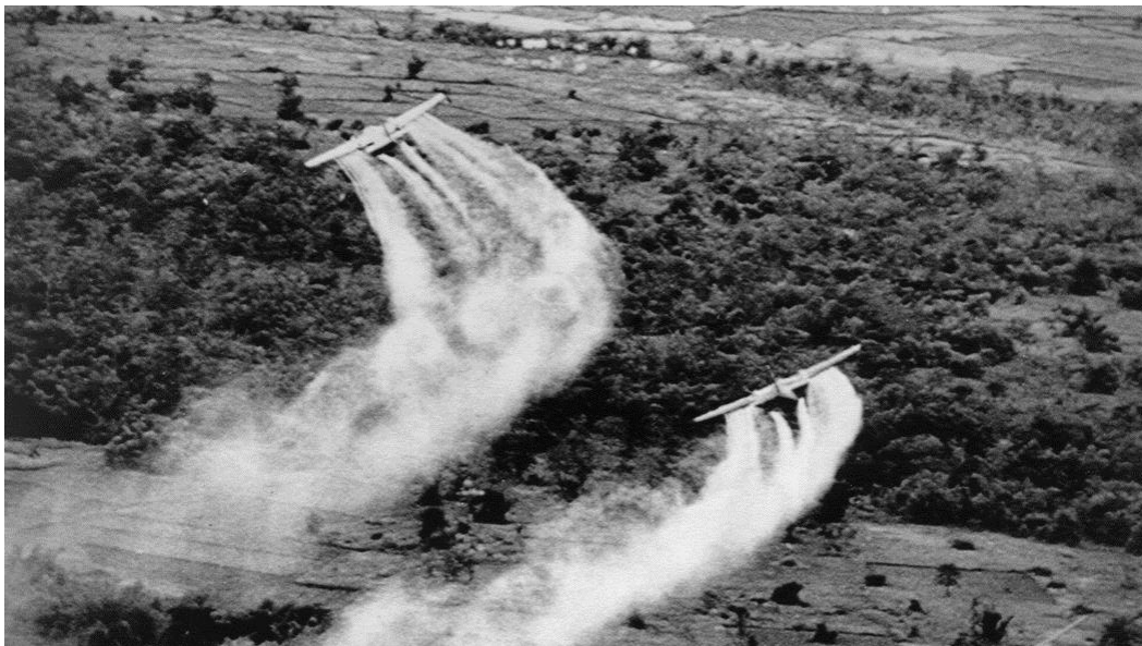
Bild från Vietnamkriget

Författaren berättar ingående om olika vapenprojekt. Redan under Vietnamkriget använde USA flygplan för att spruta ut gifter, Project Agent Orange.