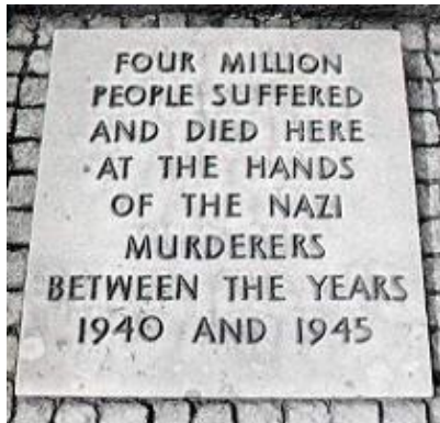
Originalplatta utanför Auschwitz-Birkenau 4 miljoner dödade

intressant uppgift som Wilhelmson kommer med är att siffran 6 miljoner används tidigare. Siffran 6 miljoner "är helig" (s.131). Redan på 20-talet pratade sionister på Wall Street om 6 miljoner judar som skulle dö. "Siffran kommer därifrån", menar Wilhelmson (s.131). I New York Times år 1920 användes siffran "i samband med en kampanj till stöd för judar i Europa" (s.146). Dessutom har begreppet holocaust använts tidigare. "I den judiska tidningen The American Hebrews , den 31 oktober 1919, skriver man om att just 6 miljoner judar hotas av en förestående holocaust ..." (s.146).