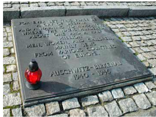
År 1995 ändrades antalet till 1,5 miljoner 11