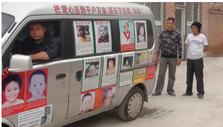
I Kina söker man de försvunna barnen med bilder på dem på bilar

Författarna berättar om de förödande konsekvenser som Kina fick på grund av sin oerhört tragiska ettbarnspolitik (s. 185ff). Det var en mycket brutal process. Fram till idag har minst 150,000 adoptioner förmedlats från Kina till Europa och Nordamerika (s. 187). De började år 1992 och ledde till en marknad med handel av barn. Det blev ekonomiskt fördelaktigt för barnhemmen i Kina att vara en del av adoptionssystemet (s. 202). Sverige hjälpte därmed Kina med att hantera ettbarnspolitiken (s. 235).